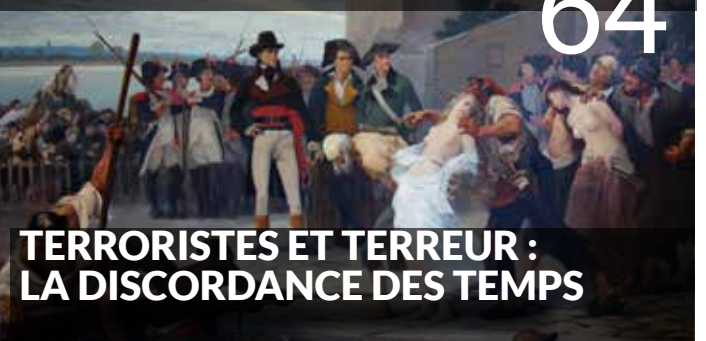
TERRORISTES ET TERREUR : LA DISCORDANCE DES TEMPS